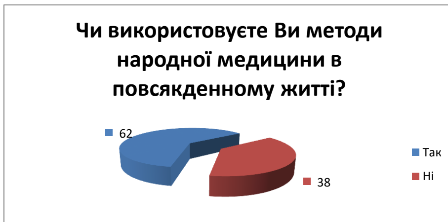
Мал. 1. Рейтинг застосування народної медицини

З метою вивчення потреб аудиторії в інформації про народну медицину нами було проведено анкетування серед населення без вікових обмежень. Опитувальник містить перелік питань для визначення рівня довіри людей академічній чи народній медицині (див. додаток А).