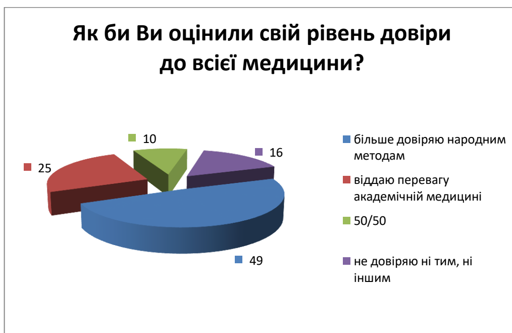
Рис. 3. Рейтинг довіри населення до медицини

Оцінюючи свій рівень довіри до медицини взагалі, 49 % відповіли, що більше довіряють народним методам (див. рис. 3)